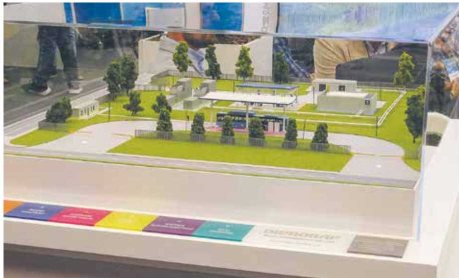
Wizualizacja stacji do tankowania wodoru to jedna z wielu ofert, które zaprezentował biznes.

do neutralności klimatycznej – m.in. o tym dyskutowano w Poznaniu podczas majowych targów „H2POLAND”.