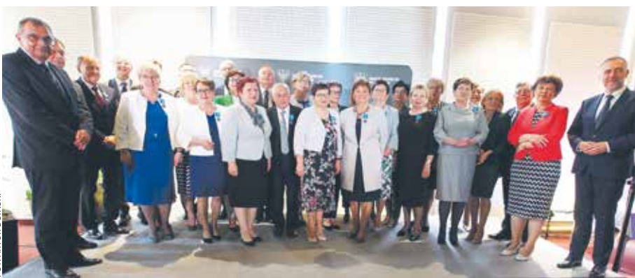
Odznaki odebrało kilkadziesiąt osób zasłużonych dla samorządu terytorialnego w Wielkopolsce.

27 maja, w rocznicę pierwszych wyborów samorządowych z 1990 roku, w UMWW uhonorowano osoby zasłużone dla wielkopolskich gmin.