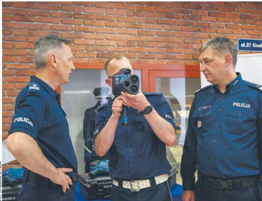
Laserowy miernik prędkości ma możliwość rejestracji obrazu.

Statystyki od lat wskazują nadmierną prędkość jako jedną z głównych przyczyn wypadków drogowych. Wielkopolscy policjanci otrzymali właśnie sześć laserowych mierników, które ostudzą zapał rajdowców.