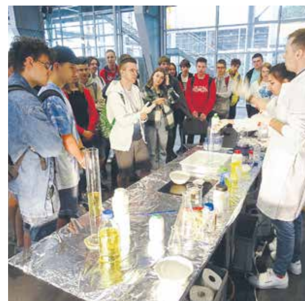
Forum towarzyszył festiwal „Nauka dla wodoru”.

– Zielony wodor jest niezbędny, aby położyć kres uzależnieniu Europy od niepewnego i niebezpiecznego dostawcy, jakim jest Rosja – stwierdziła przewodnicząca Komisji Europejskiej Ursula von der Leyen, zwracając się w specjalnym przekazie wideo do uczestników I Środkowoeuropejskiego Forum Technologii Wodorowych „H2POLAND” w Poznaniu. Przewodnicząca podkreśliła, że Wielkopolska od 2018 r. podejmuje działania, by stać się jedną z pierwszych dolin wodorowych w Europie. – Wasz plan w perspektywie do 2030 r. już przynosi efekty. Widzimy, jak konsekwentnie powstaje cały ekosystem: elektrownie opalane węglem są zastępowane przez energię słoneczną, wiatrową i biomasę. Czysta energia z OZE jest następnie przekształcana w zielony wodor, a ten pierwiastek służy z kolei do zasilania przemysłu ciężkiego czy ogrzewania domów, jak na innowacyjnym osiedlu w Pile – dodała Ursula von der Leyen, zwracając też uwagę na plany budowy w Polsce nawet stu (zasilanych wodorem) autobusów rocznie.