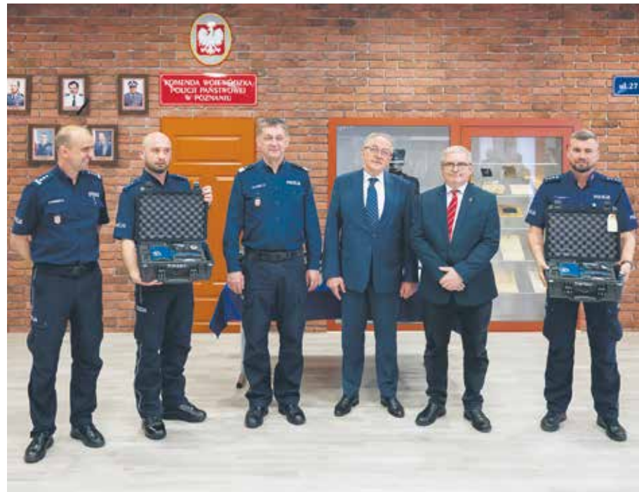
Wartość przekazanego policji sprzętu to ponad 250 tys. zł.

Działalność wielkopolskich wojewódzkich ośrodków ruchu drogowego w zakresie poprawy bezpieczeństwa na drogach dotyczy wielu płaszczyzn. Oprócz szerokiej oferty edukacyjnej skierowanej do dzieci, młodzieży i seniorów, ośrodki z Kalisza, Konina, Leszna, Piły oraz z Poznania angażują się np. w doposażenie jednostek ochotniczej straży pożarnej i policji.