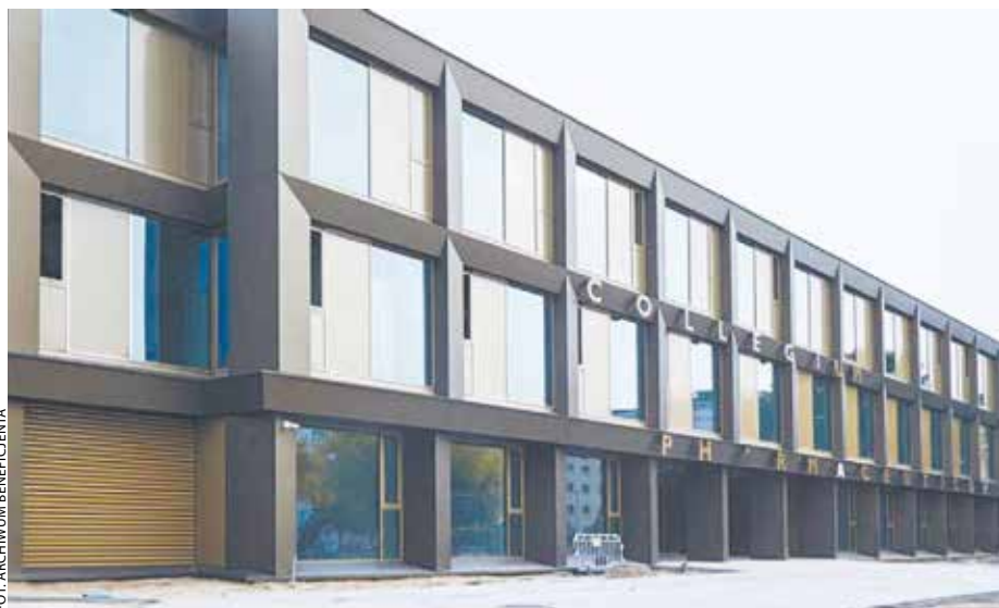
Centrum Innowacyjnej Technologii Farmaceutycznej będzie częścią powstającego Collegium Pharmaceuticum.

Jak łączyć naukę z biznesem? Uniwersytet Medyczny w Poznaniu znalazł odpowiedź.