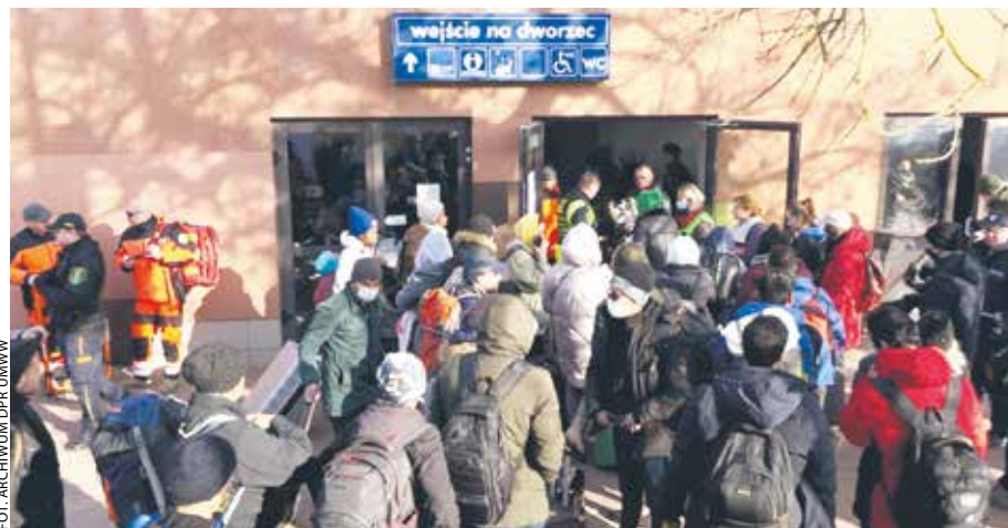
Uchodźców z Ukrainy przyjęli również Wielkopolanie.

Ukraina nie jest członkiem Unii Europejskiej, w związku z tym nie może wykorzystywać funduszy spójności do odbudowy kraju. Komisja Eu-