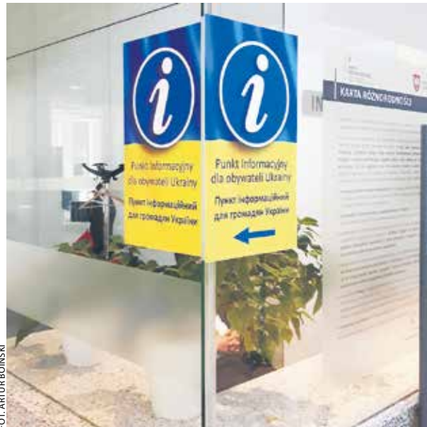
Punkt informacyjny dla Ukraińców w budynku Urzędu Marszałkowskiego w Poznaniu.

Samorząd województwa uruchomił też swój punkt informacyjny dla obywateli Ukrainy przebywających w Wielkopolsce. Znajduje się on w holu Urzędu Marszałkowskiego przy al. Nie-