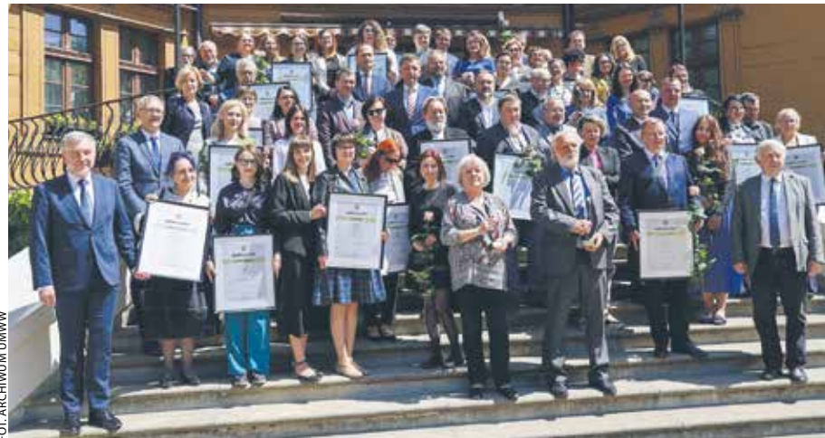
Laureaci konkursu „Izabella” na schodach pałacu w Antoninie.

23 maja w pałacu myśliwskim książąt Radziwiłłów w Antoninie nagrodzono laureatów XX edycji konkursu „Izabella”.