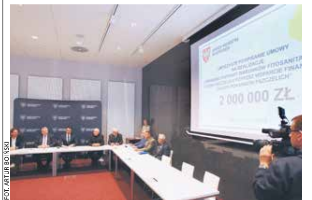
Umowy dotyczące przekazania pszczelarzom pomocy podpisano 26 maja w siedzibie samorządu województwa.

Władze województwa mają już kolejne pomysły, jak pomóc branży. W regionie mają powstać demonstracyjne pasieki, które pozwolą edukować społeczeństwo i uświadaczać, jaki pożytek przynoszą nam pracowite owady. ABO