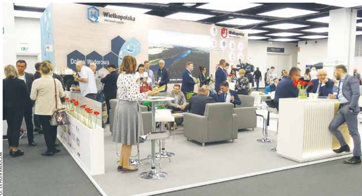
Na pierwsze w Polsce i w Europie Środkowo-Wschodniej kompleksowe wydarzenie poświęcone sprawom wodorowym zarejestrowało się aż 1500 uczestników.

„Jaką przyszłość w Europie ma wodor?” „Zeroemisyjne