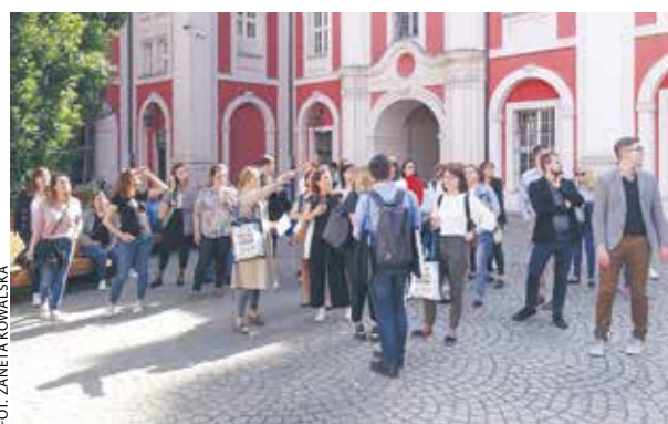
Goście zwiedzili m.in. zrewitalizowany plac Kolegiacki w Poznaniu.

Zdobyta wiedzę wykorzystają w swojej pracy, tym bardziej, że wyzwania związanych z rewitalizacją jest dużo. Przede wszystkim jeśli samorządy myślą o możliwości aplikowania o unijne środki po 2023 r., muszą przekształcić programy rewitalizacji w gminne programy rewitalizacji opracowane na bazie specjalnej ustawy. One będą podstawą do ubiegania się np. o środki