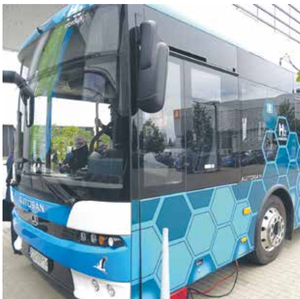
Na targi przyjechał autobus wodorowy z Autosanu.