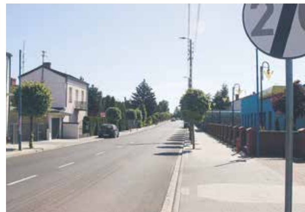
Przebudowa ul. Warszawskiej w Sompolnie i drogi gminnej w Sompolniku dofinansowana z PROW.

Wyżej ocenione będą te projekty, których realizacja nastąpi z zastosowaniem rozwiązań mających na celu poprawę bezpieczeństwa w ruchu drogowym przez budowę lub przebudowę na całym odcinku takich elementów, jak: przejście dla pieszych, przejazd dla rowerzystów, ścieżka rowerowa lub pieszo-rowerowa, chodnik, progi zwalniające, skrzyżowania,