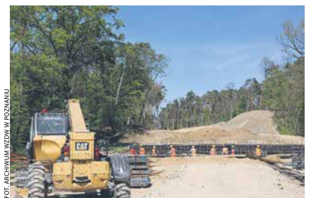
Budowa obwodnicy Gostynia kosztuje niemal 130 mln zł.

– Wartość inwestycji wynosi niemal 130 mln zł, z czego ponad 100 mln to dofinansowanie unijne z Wielkopolskiego Regionalnego Programu Ope-