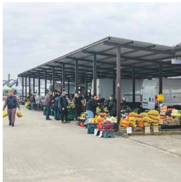
Zbudowane dzięki PROW targowisko w Rogoźnie.

– Przez ostatnie 30 lat wielkopolskie obszary wiejskie przeszły prawdziwą metamorfozę. Warto sięgnąć pamięcią wstecz. Ta pozytywna zmiana, obraz nowoczesnego rolnictwa i estetycznej wsi, to w dużej mierze zasługa naszych rolników i firm związanych z tą branżą – często liderów w krajowej produkcji, którzy śmiało i z sukcesami potrafią rywalizować na rynkach europejskich i światowych. Samorząd Województwa Wielkopolskiego, który od niemal dwudziestu lat mam zaszczyt reprezentować, też dołożył cegiełkę do pozytywnych zmian na obszarach wiejskich. Urząd Marszałkowski w Poznaniu i podległe mu instytucje konsekwentnie wdrażają rozmaite inicjatywy i programy, proponując niekiedy rozwiązania pionierskie w skali kraju, podpatrywane i realizowane następnie w innych regionach Polski. Modernizowana jest infrastruktura, poprawiają się bezpieczeństwo i warunki życia mieszkańców wsi. Wiele miliardów złotych trafiło tam w ramach Programu Rozwoju Obszarów Wiejskich oraz z budżetu województwa, a to jeszcze nie koniec finansowania odnowy tych terenów. Pamiętajmy o wsi, dbamy o nią i nadal będziemy tam inwestować.