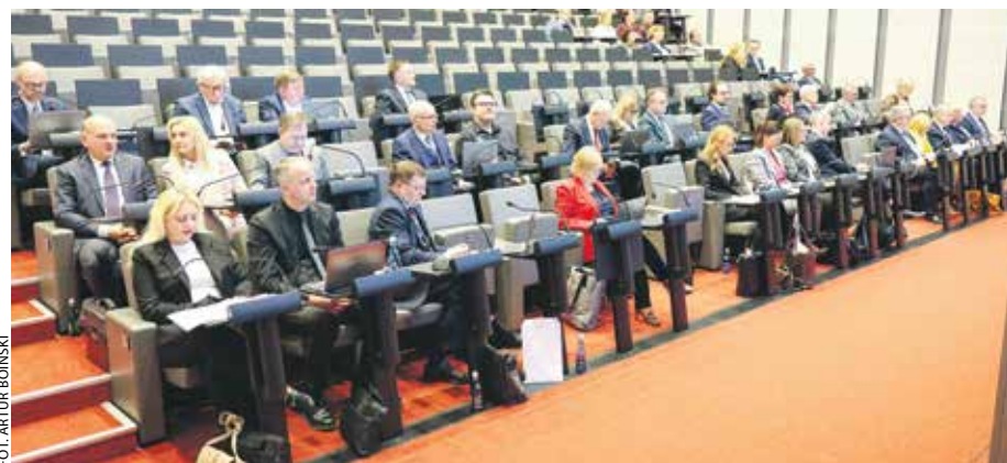
Dyskusja o wystawie w Gnieźnie trwała w sejmiku dwie godziny.

To właśnie te obrazy mogły naruszyć – także zdaniem marszałka – uczucia religijne katolików i granicę dobrego smaku w sztuce. W sposób wyważony zareagowała m.in. Kuria Metropolitalna w Gnieźnie, pisząc o szacunku dla twórczości artystów i autonomii instytucji kultury, ale