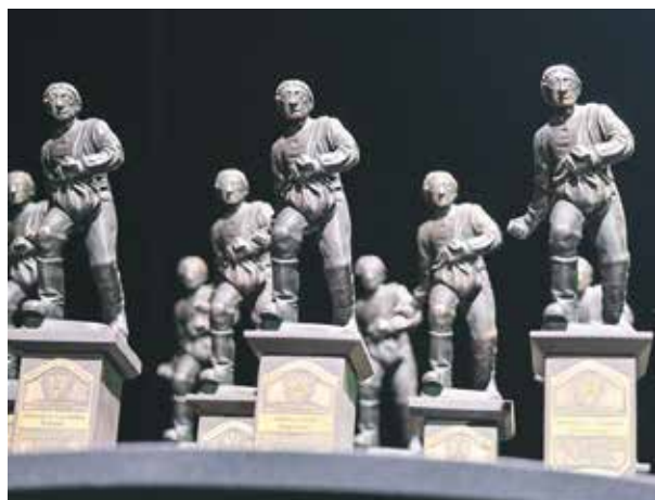
Statuetka Siewcy, czyli wielkopolski „rolniczy Oscar”...