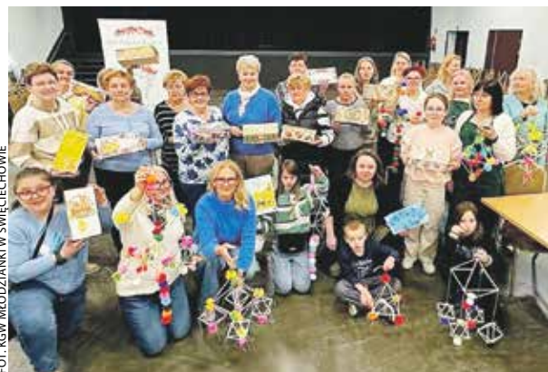
Efektom warsztatów w Świąciechowie (powiat leszczyński) były ozdobne szkatułki i pająki wielkanocne.