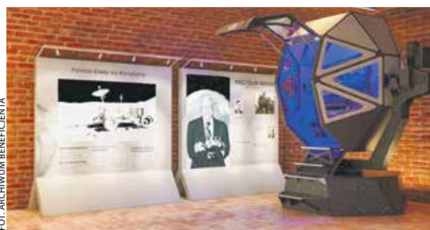
Wizualizacja Domu Zamełki z nowym wyposażeniem.

W podobnym kierunku planuje rozwijać się także Dom Zamełki w Koninie. Wyremontowany za pieniądze unijne w poprzedniej per-