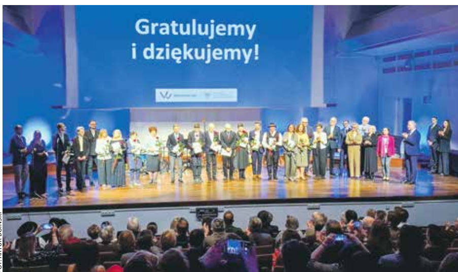
Laureaci nagród odebrali je z rąk marszałka podczas uroczystości w Auli Nova.