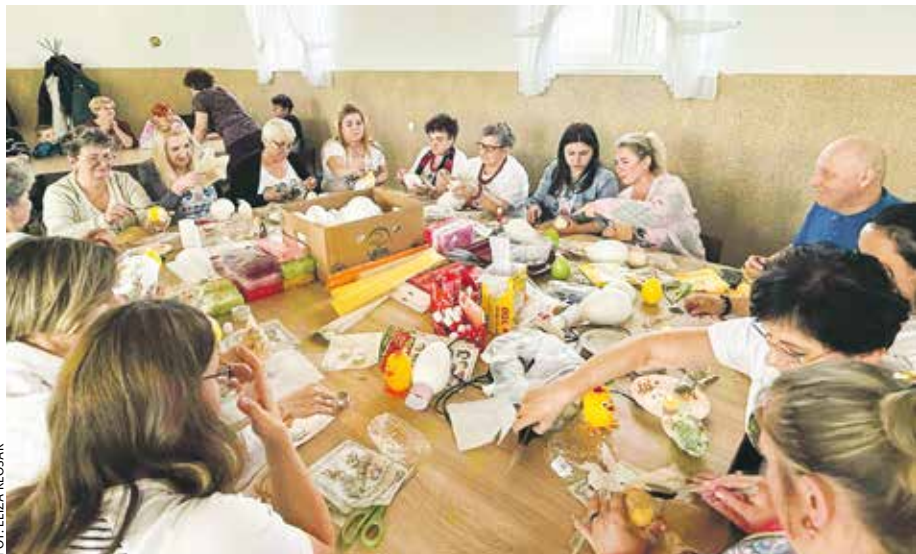
Piękne i barwne dzieła powstały w Wojciechowie w gminie Kawęczyn.

S amorząd Województwa Wielkopolskiego od wielu lat wspiera i aktywizuje koła gospodyń wiejskich w całym regionie. W regionalnym budżecie co roku coraz więcej pieniędzy przeznaczane jest na konkursy skierowane do KGW.