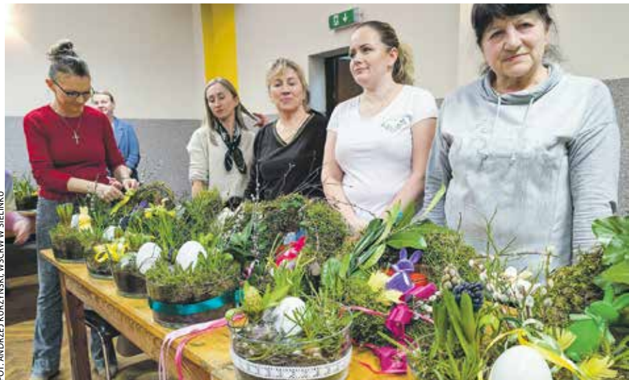
Warsztaty rękodzieła w Niedźwiedziu w gminie Ostrzeszów.

Ponad 250 osób wzięło udział w cyklu warsztatów wielkanocnych z udziałem KGW.