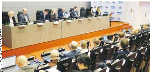
Posiedzenie Komitetu Monitorującego FEW odbyło się 31 marca.

Te działania rozpisano w dwóch nowych priorytetach FEW. Pierwszy jest związany ze „zwiększaniem zdolności technologicznych i przemysłowych w celu wspierania obronności Wielkopolski”. Będą dotowane m.in. projekty B+R, dotyczące publicznej infrastruktury podmiotów ba-