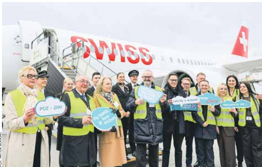
Pierwszy samolot z Zurychu uroczysto powitano na płycie poznańskiego lotniska.