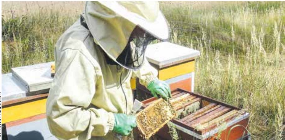
Samorząd województwa od kilku lat regularnie przekazuje wsparcie finansowe, w wysokości kilku milionów złotych, wielkopolskim pszczelarzom.

Wielkopolska jest regionem rolniczym, od lat inwestującym pieniądze z budżetu województwa i z UE, w rozwój obszarów wiejskich.