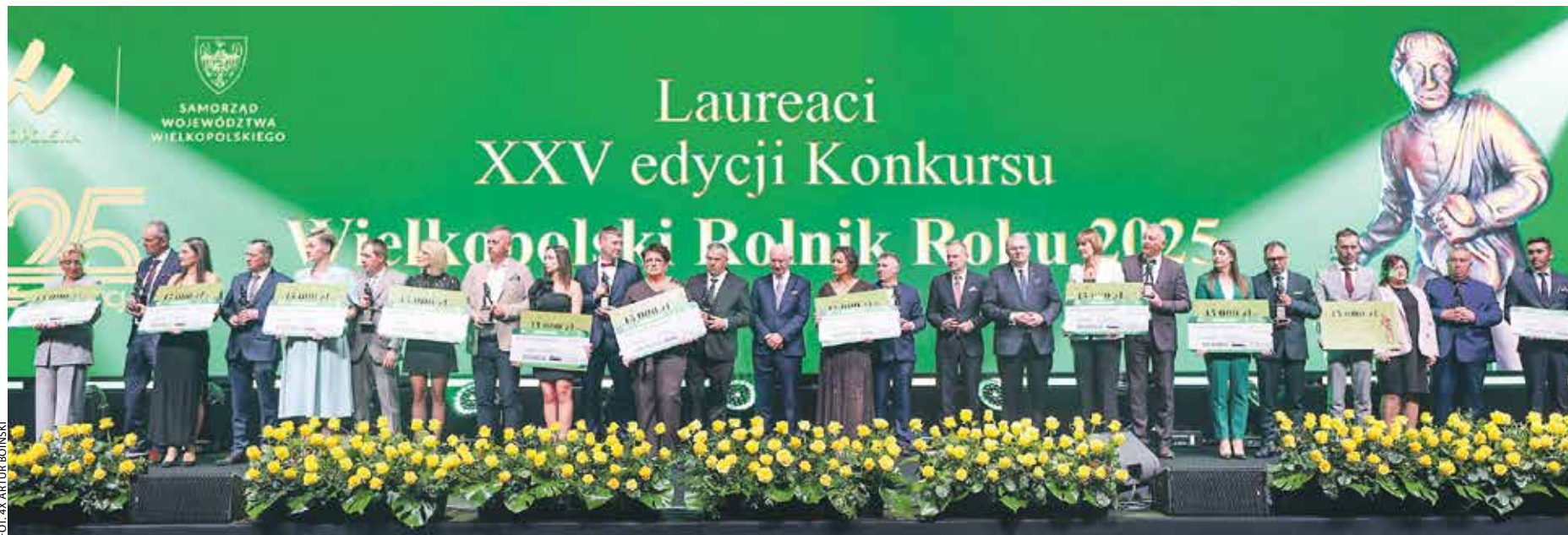
Najlepsi z najlepszych gospodarzy, czyli laureaci XXV edycji konkursu Wielkopolski Rolnik Roku na scenie w Sali Ziemi MTP.

Poznaliśmy laureatów XXV edycji konkursu Wielkopolski Rolnik Roku.