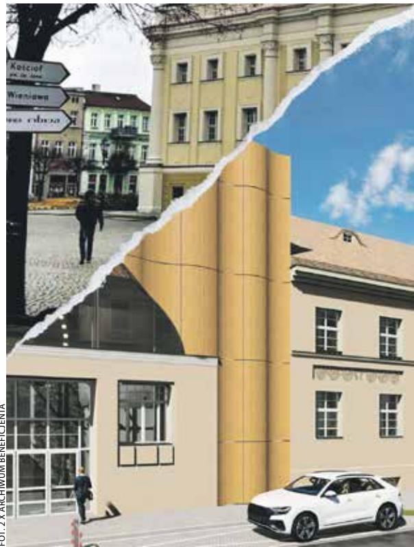
Leszno będzie miało nową salę widowiskową i jeszcze piękniejszy rynek.

Budynki dawnej siedziby biblioteki, a wcześniej Hotelu Polskiego oraz siedziby Miejskiego Ośrodka Kultury (mieszczące się przy ul. B. Chrobrego i ul. Zielonej) zostaną przebudowane. Dotychczasowa sala widowiskowa zostanie wyburzona. W jej miejscu powstanie nowa, która pomieści do 600 widzów.