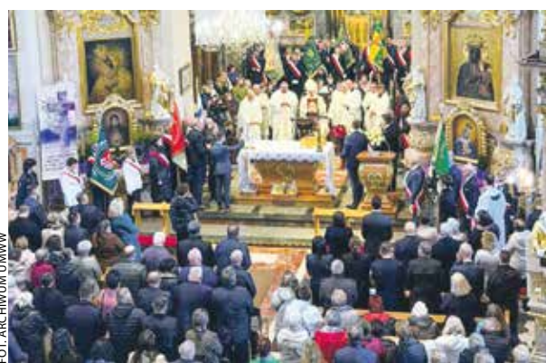
W intencji sołtysów modlono się w kaliskim sanktuarium.

Dalsza część obchodów Dnia Sołtysa odbyła się w hali widowisko-sportowej w Stawiszynie.