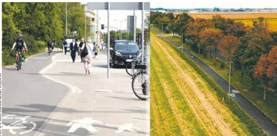
Ścieżki wzdłuż ul. Solnej w Poznaniu oraz z Jankowic do Rumianka (gmina Tarnowo Podgórne).

Powstaje 41 projektów tras dla cyklistów. Gdzie będą realizowane?