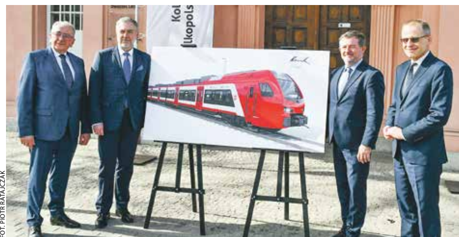
Umowę podpisano 12 marca na Dworcu Letnim w Poznaniu.

Przypomnijmy, że przetarg na zakup taboru opierał się