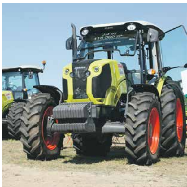
Nowoczesny sprzęt jest dziś wizytówką wsi.

Słowem: wieś przeszła metamorfozę, do której niewątpliwie samorząd województwa też się przyczynił. ■