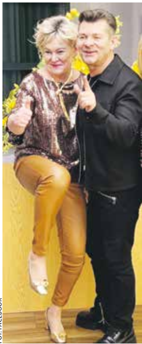
Między nami, gwiazdami...

Nie wiedzieliśmy dotąd, że mamy aż tylu fanów (lub przy najmniej osób dobrze nam życzących albo – w życzeniu nam dobrze mających jakiś interes ;-))!