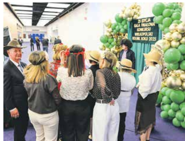
Nie brakło chętnych do zrobienia sobie zdjęcia na specjalnej ścianie.