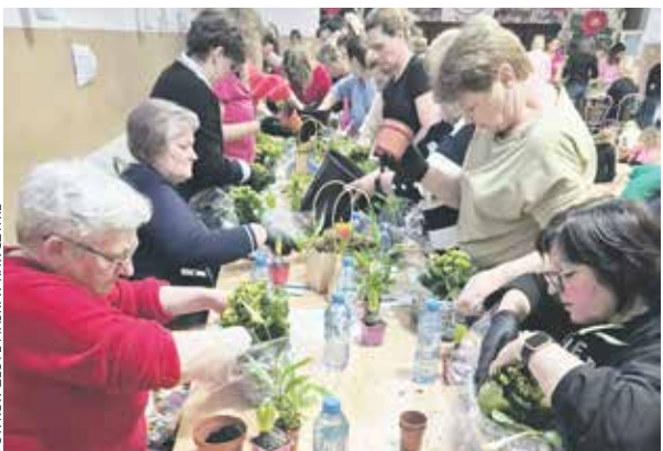
Chełst w gminie Drawsko był miejscem spotkania zorganizowanego przez KGW Złote Piaski w Kaweczynie.