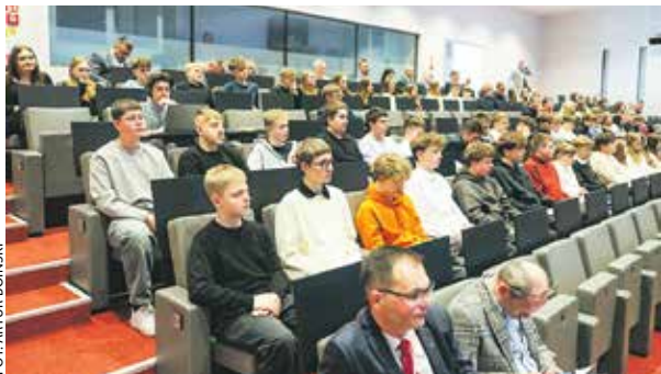
Reprezentanci Wielkopolskiej Szkoły Roku 2025, czyli SP nr 1 w Witkowie, gościli na marcowej sesji sejmiku województwa.

Rozpoczęła się kolejna edycja samorządowych konkursów na szkołę i nauczyciela roku.