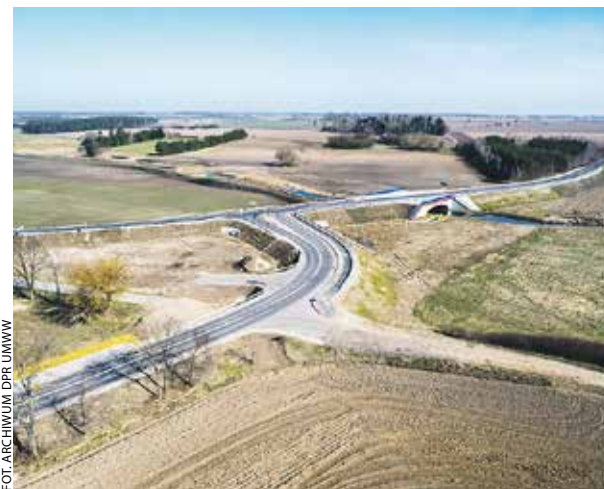
Przebudowano skrzyżowanie i most na DW 197.

Zakończyła się jedna z ważniejszych inwestycji drogowych w powiecie gnieźnieńskim. Zmienił się przebieg drogi wojewódzkiej nr 197 z Pawłowa Skockiego do Kiszkowa.