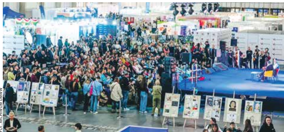
Program targów objął 70 wydarzeń towarzyszących – wykładów, warsztatów i paneli dyskusyjnych.

Inspirację do takich zmian można było znaleźć właśnie w Poznaniu. To tu uczniowie, nauczyciele, rodzice i przedstawiciele instytucji edukacyjnych mogli wymienić doświadczenia, zaprezentować (szkoły i uczelnie) ofertę i atuty, porozmawiać o trendach, spróbować przewidzieć zawody przyszłości.