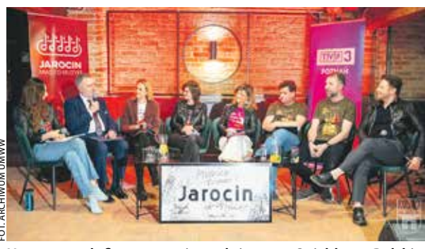
Umowę na dofinansowanie podpisano w Spichlerzu Polskiego Rocka.

Samorząd województwa przekaże 250 tys. zł na organizację tegorocznej edycji konkursu Wielkopolskie Rytmy Młodych.