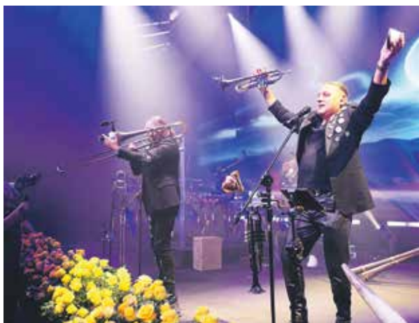
Zespół Golec uOrkiestra porwał niektórych gości do tańca.