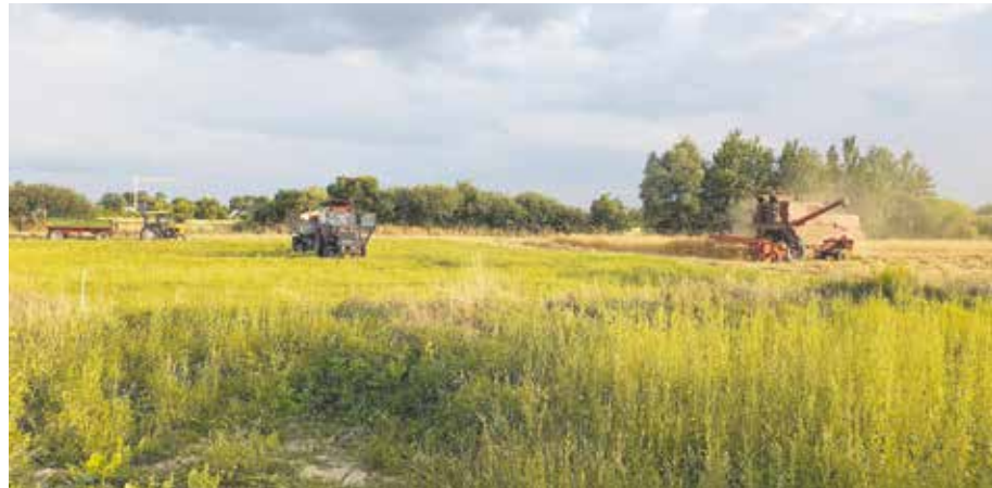
W wielu sektorach produkcji żywności (zboża, buraków cukrowych, mleka, drobiu, owoców i warzyw) nasi rolnicy wyraźnie produją w Europie.