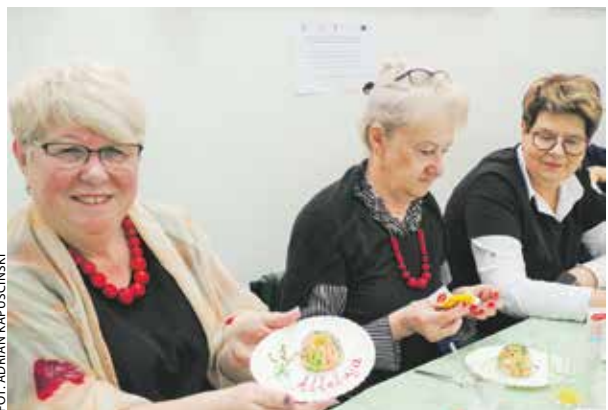
Uczestniczki warsztatów kulinarnych prowadzonych przez KGW Murzynowo Leśne w gminie Krzykosy.

Ponadto uczestnicy wszystkich tych spotkań mogli skorzystać z poczęstunku (w postaci słodkich wypieków), zapewnionego przez KGW.