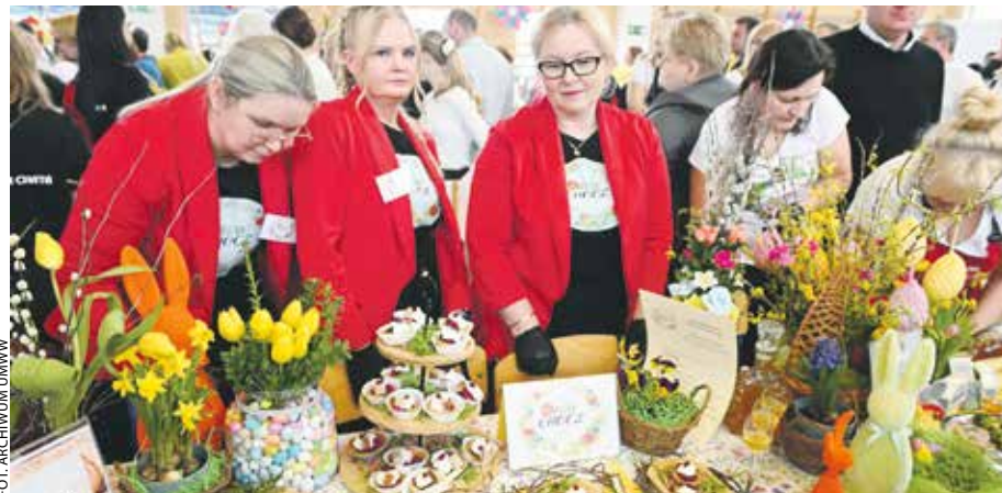
Podczas finału KGW zaprezentowały przygotowane przez siebie wielkanocne specjały.

Za najlepszą potrawę kapituła konkursowa uznała „Chrzanicę schematy – chrza-