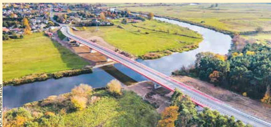
Najważniejszą z inwestycji na DW 431 była budowa nowego mostu przez Wartę w Rogalinie.

Oplatająca od południa aglomerację poznańską droga wojewódzka nr 431 w XXI wieku systematycznie zyskuje na popularności, choć... skróciła się o kilkanaście kilometrów.